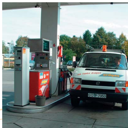
Газовая колонка с заправочным автомобилем