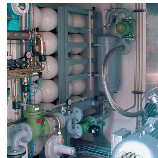
Типовое оборудование заправочной станции для легковых автомобилей