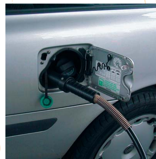
Удобная в обслуживании наполняющая муфта с одношланговой системой

Газовые заправочные станции от SAT: экономично и мощно