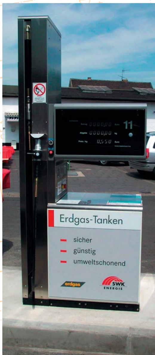
Газовая раздаточная колонка в компактном исполнении