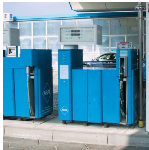
Раздаточные колонки для сжиженного (LNG) и сжатого (CNG) природного газа на одной заправочной станции (LCNG)

Сеть газовых заправочных станций в Германии, а также в других европейских странах, быстро увеличивается, так как целью Европейского Сообщества является перевод до 2020 года не менее 10% всех автомобилей на природный газ. Каждую неделю в Германии вводится в эксплуатацию в среднем 2 новые газовые заправочные станции. Мировые запасы газа составят в будущем в общем и целом двойную величину по сравнению с запасами нефти. Природный газ является источником энергии, а нефть – сырьём для многих видов современной промышленной продукции. Природный газ подготавливает путь для применения в будущем водорода в качестве автомобильного топлива