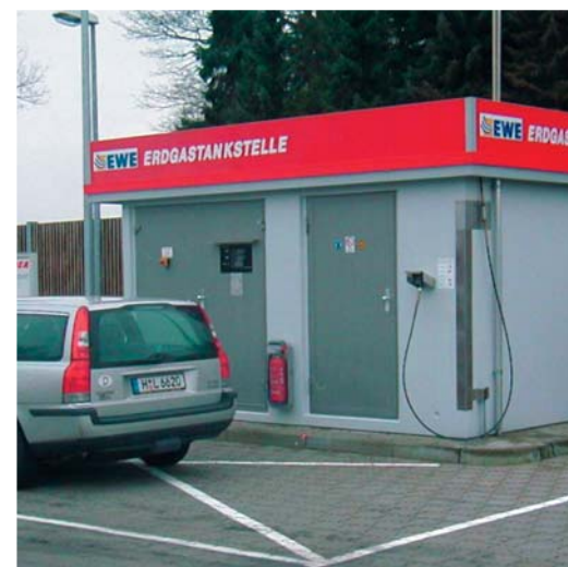
CNG-заправочная станция со встроенной раздаточной колонкой