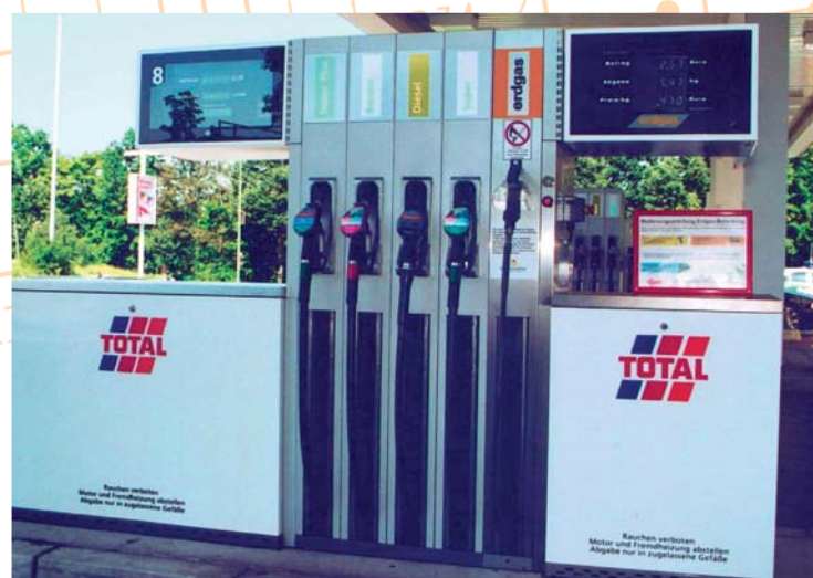
Мультитопливная заправочная колонка: жидкое топливо и природный газ

Область услуг, предлагаемых SAT, включает консультацию заказчиков при проектировании заправочных станций и получении разрешений в официальных учреждениях, комплексное проектирование оборудования (механическая и электрическая части), изготовление оборудования (компрессорный модуль, накопительный модуль, заправочная колонка), монтаж оборудования на месте эксплуатации, а также его техническое обслуживание.